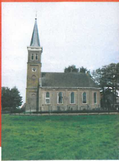
De zuidzijde van kerk en toren op het verhoogd gelegen kerkhof.