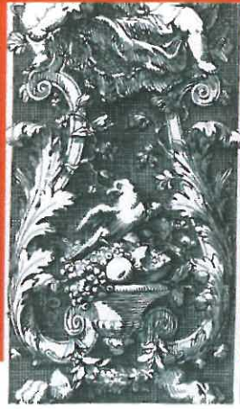
Prent van Daniël Marot gebruikt voor het ontwerp van de preekstoelpanelen.