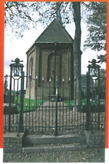
Het toegangshek met de gebruikelijke doodssymboliek aan de oostkant van het kerkhof.

en lambrisering zijn samen met de roodbruine kleuren van het orgel en de onderdelen van de orgelgalerij vrijwel ongewijzigd. Slechts de vloer is aangepast, van roodbruin naar blauwgrijs, vermoedelijk in 1956 toen enkele wijzigingen plaatsvonden.