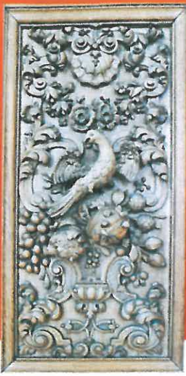
Een van de fraai gesneden panelen uit de preekstoel voorzien van een papegaaiachtige vogel.