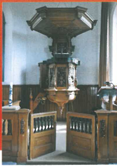
Het liturgisch centrum uit 1889 met de achttiende-eeuwse preekstoel.