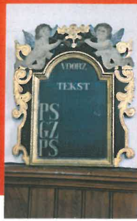
Een van de twee primitief geschilderde tekstborden uit de achttiende eeuw.