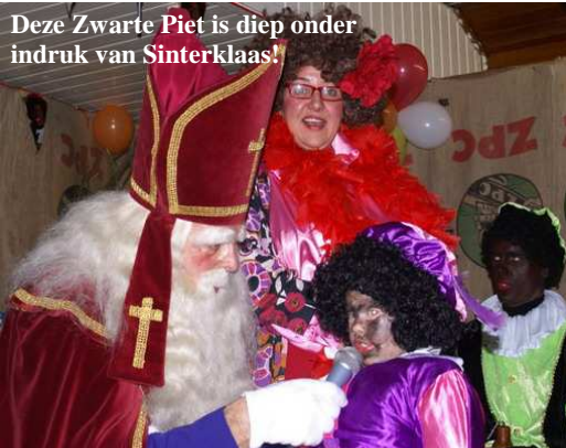
Deze Zwarte Piet is diep onder indruk van Sinterklaas!

Zaterdag 21 november is Sinterklaas massaal en op een wel erg speciale manier door de inwoners van Ouwe-Syl binnen gehaald. Even na 10 uur 's morgens komt de oude baas vanuit de mist opdoemen en legt de praam aan bij de aanlegsteiger. Enkele honderden inwoners met veel kinderen hebben aan de oproep om vooral te komen gehoor gegeven. Na de ontvangst spreekt Sinterklaas de kinderen vanuit het café toe en start voor hem een razend drukke tijd. Scholen en verenigingen worden aangedaan, ook wordt de Spanjaard zelf in de Aerden Plaats bezocht. Na twee weken vliegen, draven, rennen en wakker liggen van het klokgeluid van de Julianatoren, verlaat de Madrileen maandag 7 december