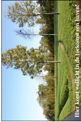
Hier komt wellicht in de toekomst een haven!

Om de leefbaarheid op het dorp nog meer te vergroten en om de plaatselijke ondernemers meer kans op de markt te bieden, wil dorpsbelang inzetten op meer Recreatie & Toerisme. Steeds meer vakantiegangers zoeken de rust en ruimte van Noord/West Friesland, de minicampings in deze regio zijn hier een voorbeeld van. Uiteraard kan Ouwe-Syl hier wellicht van meeprofiteren door hier op in te spelen. Er vanuit gaande dat Ouwe-Syl wordt aangesloten op de elfsteden vaarroute, ligt er een stuk ontwikkeling mbt Recreatie & Toerisme open. Een werkgroep houdt zich hier intensief mee bezig, waarbij de volgende plannen leven; Op het huidige (lege) recreatieterrein komt een jachthaven met plek voor ± 30 boten, hierbij willen we ook een boothelling realiseren. Er wordt gedacht om de kade aan de v.Albadaweg geschikt te maken voor aanlegplaatsen, zodat je ook met de