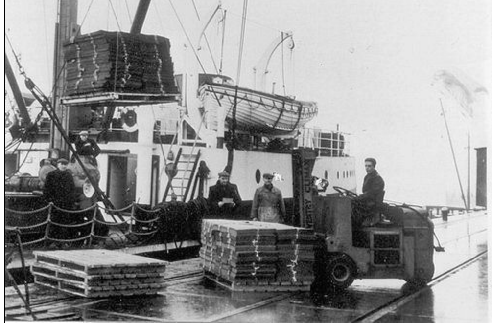
Het laden van de SWIFT in de Nieuwe Willemshaven te Harlingen

De "Swift" bleef Harlingen meer dan tien jaar trouw. Wekelijks lag het schip in de Nieuwe Willemshaven bij de nieuwe loods van de General Steam haar vracht te laden voor Londen en na 1958 ook wel voor Felixstowe. Strokarton uit Groningen, onder andere aangevoerd per spoor, was altijd een belangrijk deel van de lading. Verder halve varkens, aangevoerd per binnenvaarder en zuivelproducten. Volgeladen voer de "Swift" dan met een gangetje van 12 mijl richting Londen om daar de volgende dag te arriveren. Ergens aan de Thames in het labyrint van dokken, kanalen en pakhuizen, niet zo ver van de beroemde Towerbridge, had de General Steam haar etablissement. De lading van die de "Swift" uit Harlingen aanvoerde was voor een groot deel bestemd voor Londen. De halve varkens gingen na bewerking als bacon over de toonbank en ook de Friese boter vond zijn weg naar de Londenaar. In het Eastend van Londen had men het liefst de gezouten Friese boter. Tegenwoordig vinden deze producten nog altijd aftrek op de Britse markt, maar ze worden niet meer vanuit Harlingen aangevoerd.