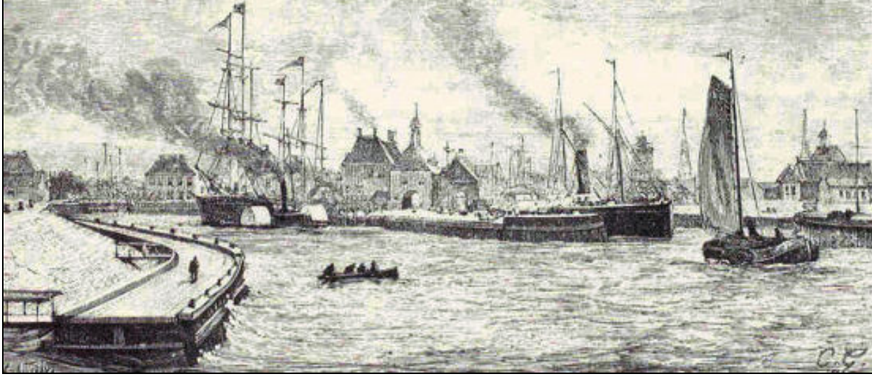
De haven van Harlingen in het midden van de negentiende eeuw. Rechts ligt een radarstoomboot. Op deze plaats lag jarenlang de boot voor Londen aangemeerd.

Het was in 1845 dat de eerste stoomboot van de General Steam uit Londen in Harlingen aankwam. Het was de RAPID een stoomradarbootje van nog geen 300 ton. Er is geen afbeelding van. Harlingen was in 1845 de belangrijkste haven in het Noorden van het land. Veel landbouwproducten werden toen al met zeilschepen vanuit Harlingen naar Engeland vervoerd. Maar de stoomschepen werden meer zekerheid van betref aankomst en vertrektijden. Er werd veel levend vee meegenomen en de schepen van General Steam vertrokken meestal op de dag na de veemarkten. De veemarkt in Sneek was op dinsdag en in Leeuwarden was de veemarkt op vrijdag. Ook Friese boter werd met de schepen van de General Steam vervoerd naar Londen. Tot 1920 was de vaste aanlegplaats van de Londenboot het oude Zuiderhoofd vlakbij de Havenpoort. De radar stoomschepen die de eerste decennia jaren de lijndienst Harlingen - Londen onderhielden waren de MAGNET en de LION. In 1860 werd de NORA daaraan toegevoegd. De NORA was het schip wat in 1862 met een lading boter terugkeerde omdat de afnemers in Londen het van Friese de slechte kwaliteit niet accepteerden. Het werd als de boterschandaal wat de Friese zuivelindustrie schade zou berokkenen. De laatste radar stoomschepen die van Harlingen op Londen voeren waren de HOLLANDIA en de TAURUS.