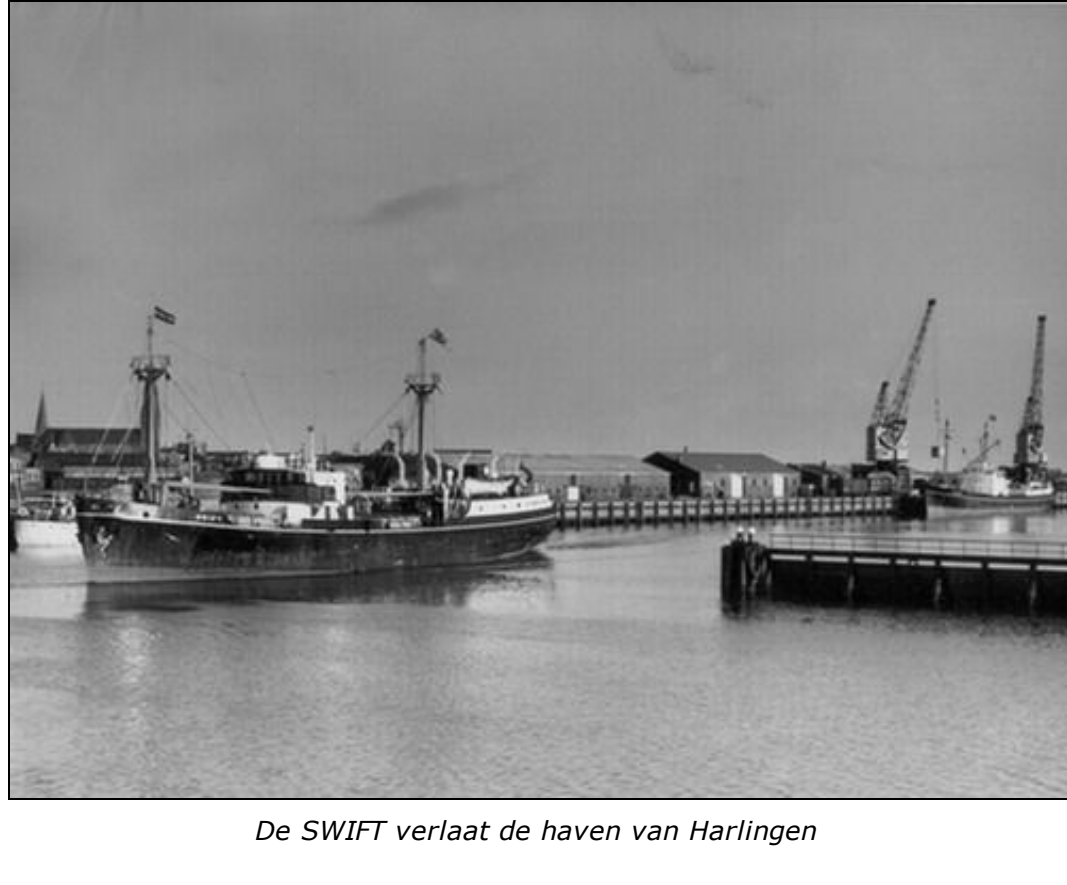
De SWIFT verlaat de haven van Harlingen

In 1954 voegde de in Londen gevestigde General Steam Navigation Company het motorschip "Swift" toe aan de lijndienst Harlingen - Londen. Deze maatschappij onderhield al meer dan honderd jaar een vaste verbinding tussen Harlingen en de Britse hoofdstad met kleine vrachtschepen zoals de "Swift". De opbouw van de "Swift" had veel weg van de Engelse kolenboten die voor de tweede wereldoorlog kolen vanuit de Engelse mijnbouwstreken naar havens van het West-Europese vasteland vervoerden. De brug van de "Swift" stond midden op het schip en de machinekamer zat achterin het schip. De "Swift" was echter geen kolenboot. Door het laadgerei, dat bestond uit twee masten met elk twee laadbomen, kon je al van verre zien dat dit schip gebouwd was om stukgoed te vervoeren. Met zijn 757 bruto registerton deed het de titel kustvaarder alle eer aan. In de vijftiger jaren, de "Swift" was in 1950 gebouwd en hetel veel rederijen niet alleen functionele schepen bouwen maar hechtte men ook nog enige waarde aan het uiterlijk van de schepen. Daarom kreeg de "Swift" een met teakhout betimmerde brug wat het uiterlijk van het schip ten goede kwam. Twee luikhoofden gaven toegang tot het ruim waar zo'n 900 ton lading gestouwd kon worden.