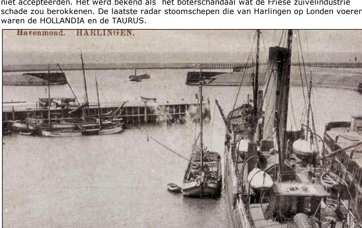
Een schroefstoomschip van de General Steam ligt te laden aan het Zuiderhoofd. Op het achterdek is de ronde lichtbak te zien voor de passagiersaccommodatie.

Het was in 1845 dat de eerste stoomboot van de General Steam uit Londen in Harlingen aankwam. Het was de RAPID een stoomradarbootje van nog geen 300 ton. Er is geen afbeelding van. Harlingen was in 1845 de belangrijkste haven in het Noorden van het land. Veel landbouwproducten werden toen al met zeilschepen vanuit Harlingen naar Engeland vervoerd. Maar de stoomschepen werden meer zekerheid van betref aankomst en vertrektijden. Er werd veel levend vee meegenomen en de schepen van General Steam vertrokken meestal op de dag na de veemarkten. De veemarkt in Sneek was op dinsdag en in Leeuwarden was de veemarkt op vrijdag. Ook Friese boter werd met de schepen van de General Steam vervoerd naar Londen. Tot 1920 was de vaste aanlegplaats van de Londenboot het oude Zuiderhoofd vlakbij de Havenpoort. De radar stoomschepen die de eerste decennia jaren de lijndienst Harlingen - Londen onderhielden waren de MAGNET en de LION. In 1860 werd de NORA daaraan toegevoegd. De NORA was het schip wat in 1862 met een lading boter terugkeerde omdat de afnemers in Londen het van Friese de slechte kwaliteit niet accepteerden. Het werd als de boterschandaal wat de Friese zuivelindustrie schade zou berokkenen. De laatste radar stoomschepen die van Harlingen op Londen voeren waren de HOLLANDIA en de TAURUS.