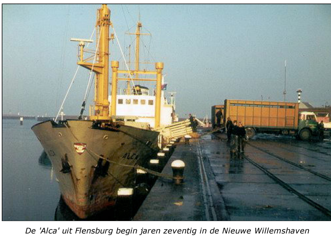
De 'Alca' uit Flensburg begin jaren zeventig in de Nieuwe Willemshaven

Toen halverwege de negentiende eeuw de stoomvaart vanuit Harlingen op Groot-Brittannië goed op gang kwam werd de uitvoer van levend vee naar dit land belangrijk. Koeien, varkens, schapen maar ook Friese paarden die de rijke Engelsen voor hun rijtuigen wilden hebben gingen in Harlingen het schip in. Er werd in die tijd veel geld verdiend door de Friese boeren die daardoor in een zekere welstand kwamen. De Friese boerinnen hielden de zilversmeden in steden zoals Leeuwarden, Harlingen en Bolsward aan het werk en de 'âlde foareinen' van veel kop hals romp boerderijen werden neergehaald en vervangen door nieuwere ruimere woongedeelten.