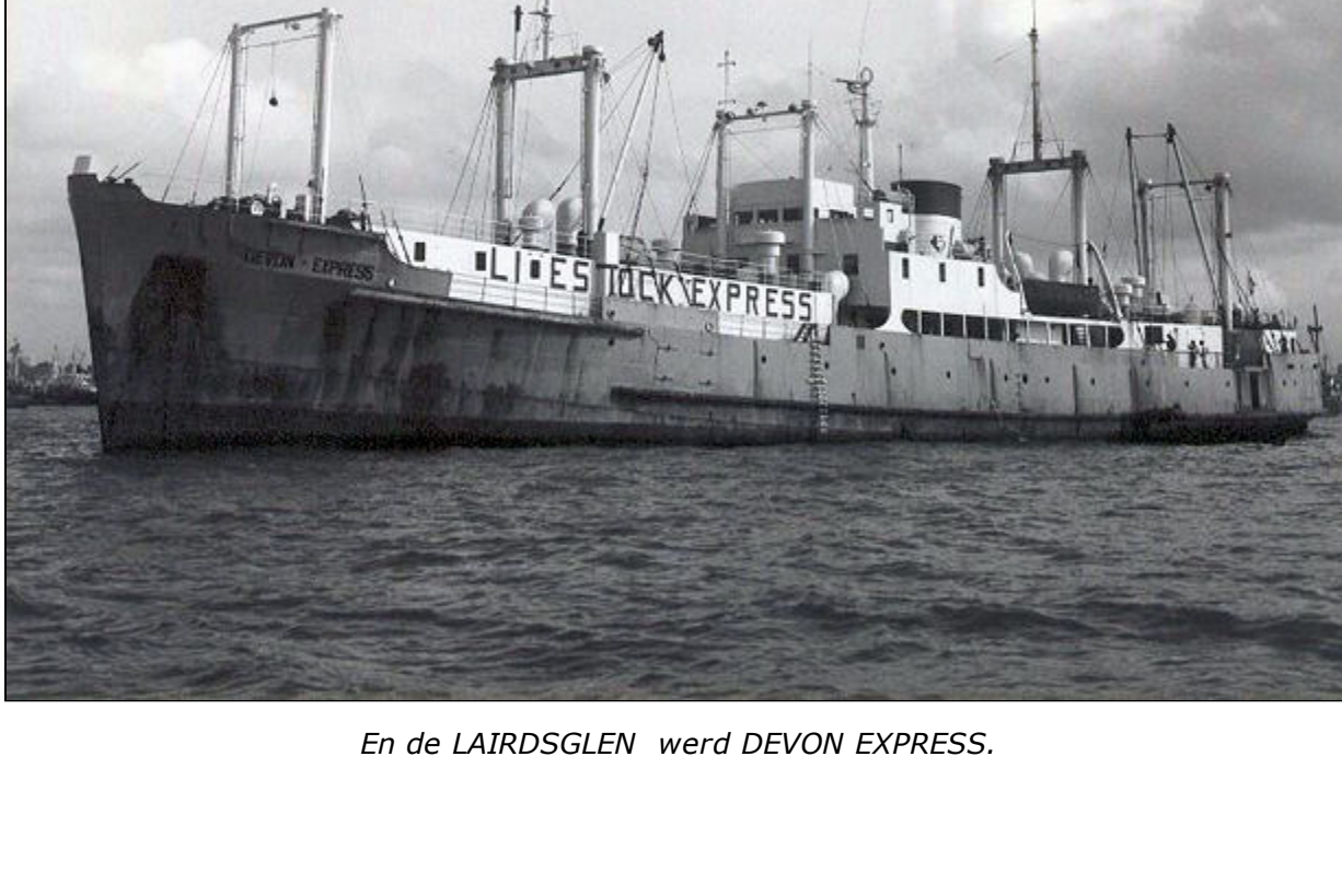
En de LAIRDSGLEN werd DEVON EXPRESS.