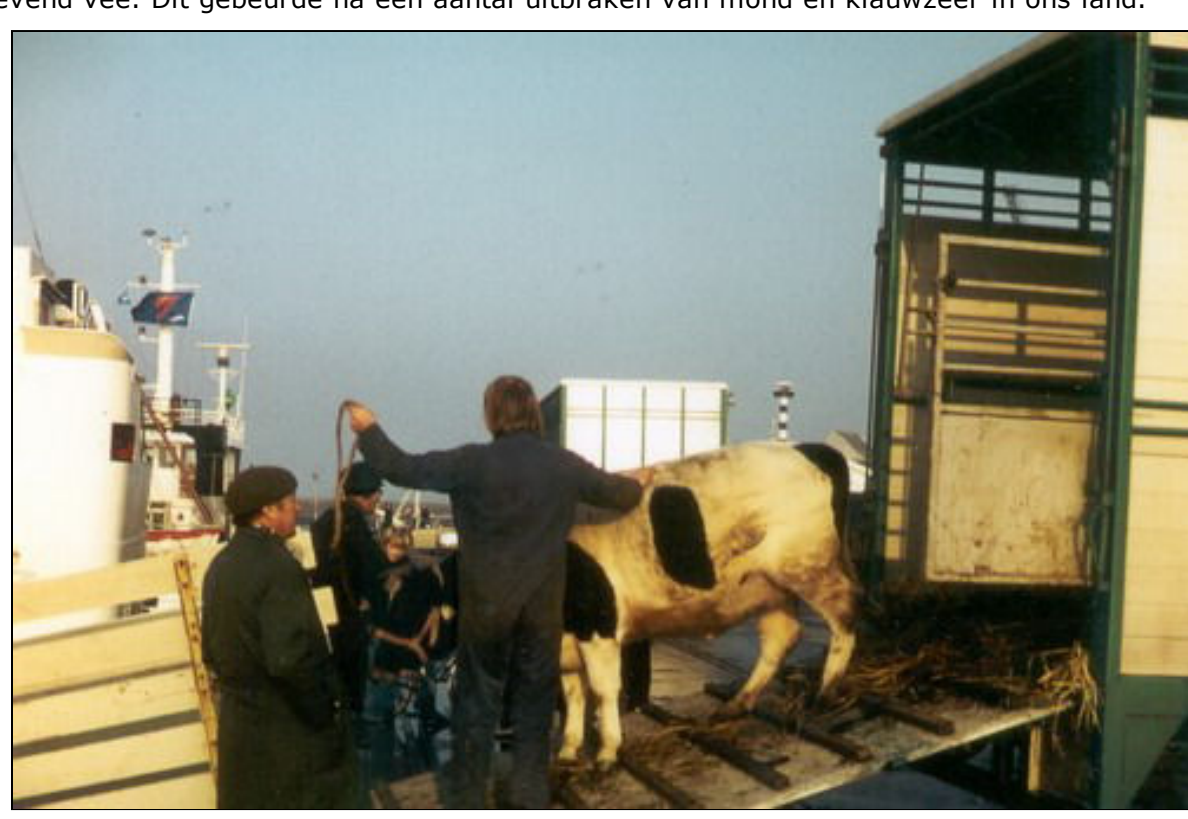
De koeien gaan aan boord. Op weg naar hun nieuwe thuisland

Iedere dinsdag was er veemarkt in Sneek en iedere vrijdag in Leeuwarden. Daarom vertrokken de lijnschepen op Londen en Hull van de General Steam en andere Britse scheepvaartmaatschappijen op woensdag en zaterdag vanuit Harlingen naar Engeland. De dag en de nacht ervoor waren per schip, per trein of lopend kuddes beesten in Harlingen aangekomen. Deze intocht van dieren met hun begeleiders maakten de toch al zo levendige havenstad nog levendiger. Wagens met knorrende en krijsende varkens reden door de stad en kudden schapen wrongen zich door de Hoogstraat de stad in op weg naar de veestallingen bij het Dok en bij de Zuiderhaven. Op het rangeerterrein arriveerden de veewagens van de Staatsspoorwegen met slachtkoeien. Tot 1892 speelden zich wekelijks deze tafereelen af. In genoemd jaar verbood de Engelse regering definitief de import van levend vee. Dit gebeurde na een aantal uitbraken van mond en klauwzeer in ons land.