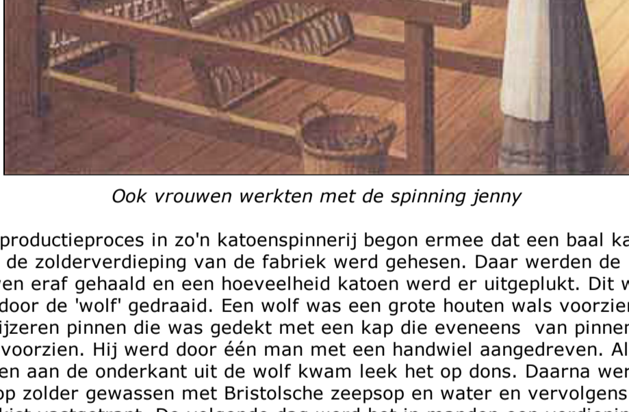
Ook vrouwen werkten met de spinning jenny

H et productieproces in zo'n katoenspinnerij begon ermee dat een baal katoen naar de zolderverdieping van de fabriek werd gehesen. Daar werden de touwen eraf gehaald en een hoeveelheid katoen werd er uitgeplukt. Dit werd dan door de 'wolf' gedraaid. Een wolf was een grote houten wals voorzien van drie stenen pinnen die was gedekt met een kap die eveneens van pinnen was voorzien. Hij werd door één man met een handwiel aangedreven. Als de katoen aan de onderkant uit de wolf kwam leek het op dons. Daarna werd het op zolder gewassen met Bristolsche zeepsop en water en vervolgens in een kist vastgetrapt. De volgende dag werd het in manden en gewassen lager gebracht. Daar stonden de voorbereidingsmachines. Een vloormachine, twee krasmachines en twee drolmachines. Alle werden met een handwiel door een man of vrouw aangedreven. Met de vloormachine, die bestond uit een aantal rollen op met krassen(pennen) erop, werd van gewassen katoen een mat gemaakt die op een rol werd gedraaid. Was deze rol vol dan werd deze vervolgens door één van de krasmachines gedraaid die er plukken(lonten) van maakte. Deze plukken werden door een meisje, de droller, op een 'doek zonder eind'(een lopende band) achter elkaar gelegd waarna ze door de drolmachine geleid werden waarin de plukken in elkaar gedraaid werden tot één lengte die op een houten pen werd gedraaid. Als zo'n pen was volgedraaid heette dat een sloep. Deze sloepen werden naar de begane grond gebracht waar de spinmachines stonden.