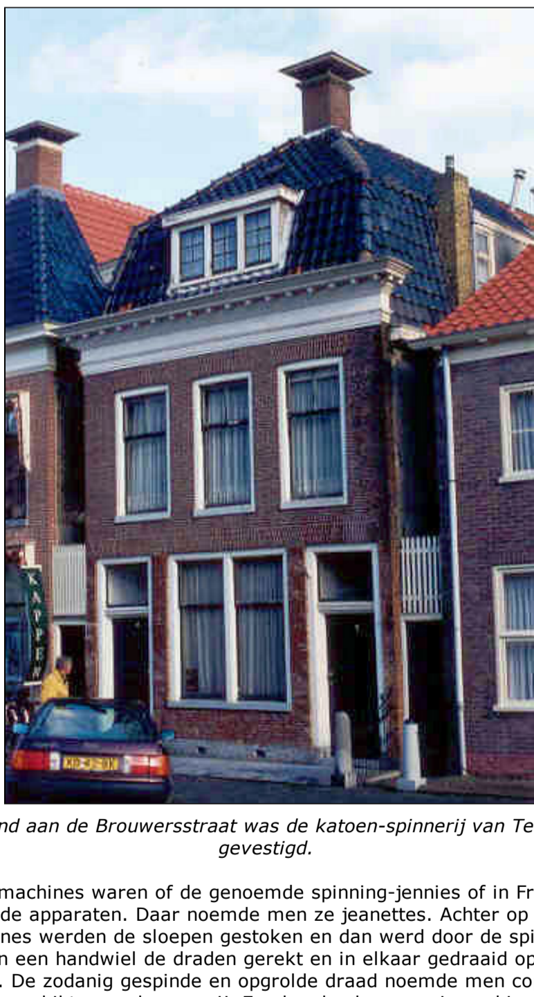
In dit pand aan de Brouwersstraat was de katoenspinnerij van Telsemeyer gevestigd.

H et productieproces in zo'n katoenspinnerij begon ermee dat een baal katoen naar de zolderverdieping van de fabriek werd gehesen. Daar werden de touwen eraf gehaald en een hoeveelheid katoen werd er uitgeplukt. Dit werd dan door de 'wolf' gedraaid. Een wolf was een grote houten wals voorzien van drie stenen pinnen die was gedekt met een kap die eveneens van pinnen was voorzien. Hij werd door één man met een handwiel aangedreven. Als de katoen aan de onderkant uit de wolf kwam leek het op dons. Daarna werd het op zolder gewassen met Bristolsche zeepsop en water en vervolgens in een kist vastgetrapt. De volgende dag werd het in manden en gewassen lager gebracht. Daar stonden de voorbereidingsmachines. Een vloormachine, twee krasmachines en twee drolmachines. Alle werden met een handwiel door een man of vrouw aangedreven. Met de vloormachine, die bestond uit een aantal rollen op met krassen(pennen) erop, werd van gewassen katoen een mat gemaakt die op een rol werd gedraaid. Was deze rol vol dan werd deze vervolgens door één van de krasmachines gedraaid die er plukken(lonten) van maakte. Deze plukken werden door een meisje, de droller, op een 'doek zonder eind'(een lopende band) achter elkaar gelegd waarna ze door de drolmachine geleid werden waarin de plukken in elkaar gedraaid werden tot één lengte die op een houten pen werd gedraaid. Als zo'n pen was volgedraaid heette dat een sloep. Deze sloepen werden naar de begane grond gebracht waar de spinmachines stonden.