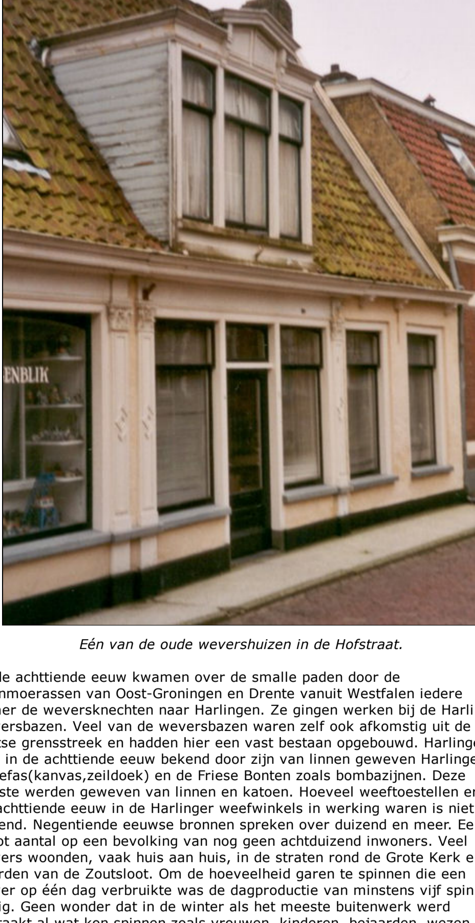
Eén van de oude wevershuizen in de Hofstraat.

I k heb in onderstaand verhaal gebruik gemaakt van een artikel dat staat in een nummer van de TUBANTIA uit 1924. Een oude Tukker vertelt daarin hoe hij als zevenjarige in een katoenspinnerij ging werken rond 1840. Tevens beschrijft hij de verwerking van de katoen in zo'n fabriek en de machines die ervoor gebruikt werden.