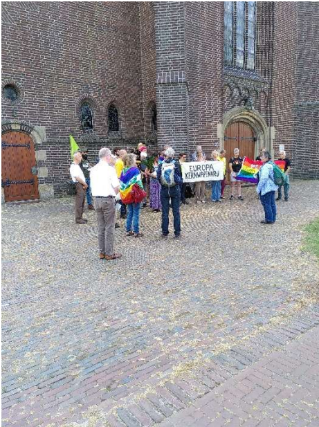
Bij de katholieke kerk in Volkel. De pastoor op de rug gezien.