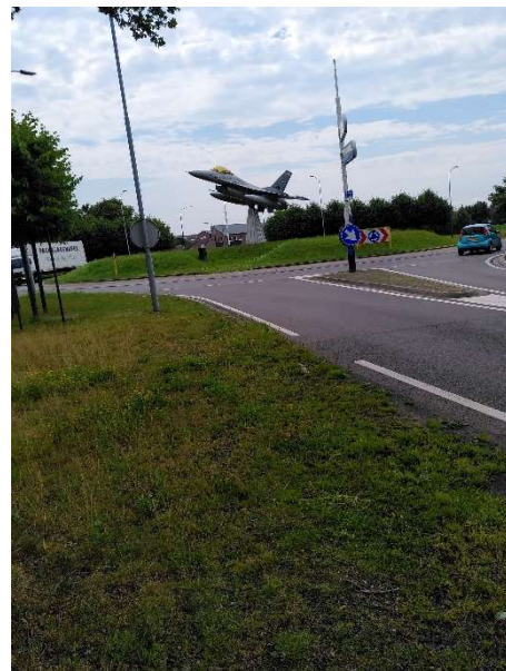
Tussen Volkel en de vliegbasis een bizar standbeeld voor de straaljager