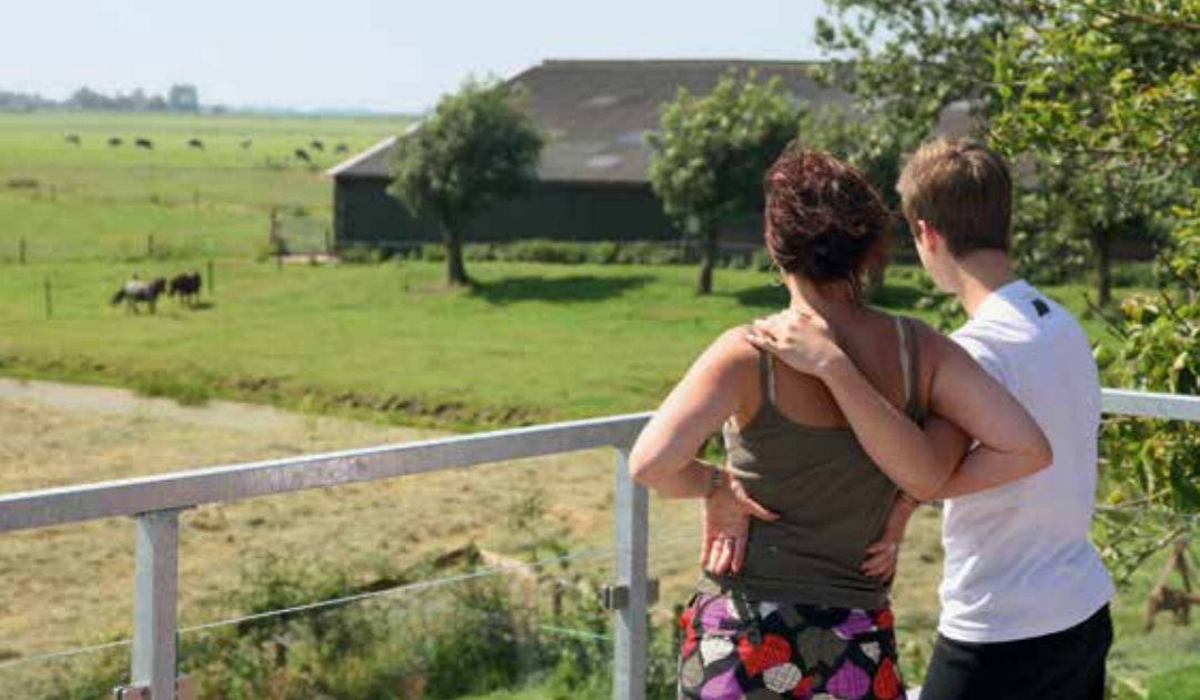
Die Sonnenterrasse bietet eine offene Sicht bis zum Horizont: grüne Wiesen, schmale Wassergräben, Kühe, Pferde, kleine Bauernhäuser. Typisch Friesland.