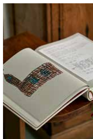
Seite für Seite erzählt das Gästebuch von glücklichen Besuchern und schönen Ferien.