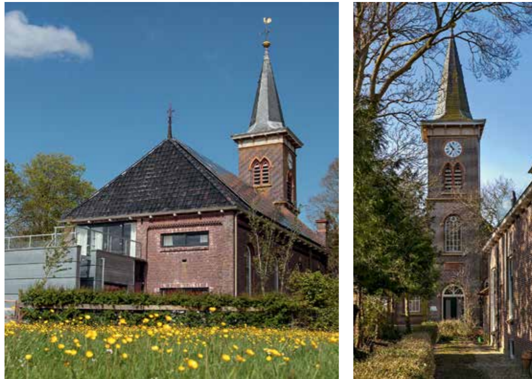
Auszeit unterm Glockenturm: Nach vier Monaten Umbau wurde aus der leerstehenden Kirche anno 1908 eine Unterkunft für Urlauber. Der neue Anbau dient als Terrasse und beherbergt drei Schlafzimmer.

Eine Kanzel im Esszimmer, eine Orgel in der Küche und ein Gewölbe an der Decke: In Friesland in den Niederlanden wurde eine ehemalige Kirche zur Ferienwohnung umgebaut.