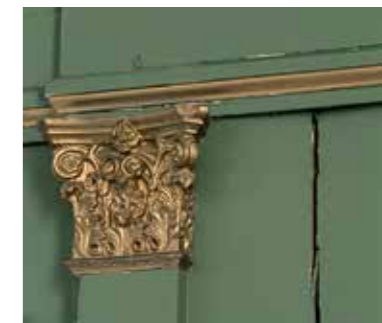
Auf der Orgel sind tiefe Risse und abgeplatzte Farbe willkommene Spuren des Alters.