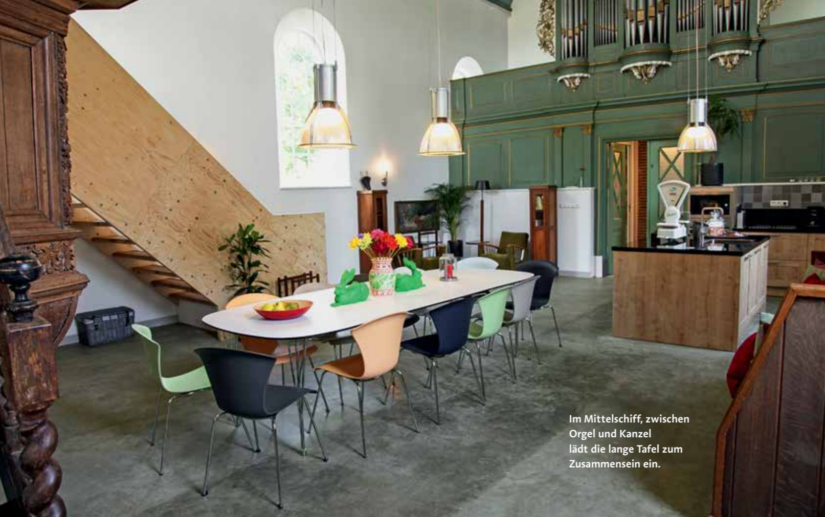
Im Mittelschiff, zwischen Orgel und Kanzel lädt die lange Tafel zum Zusammensein ein.