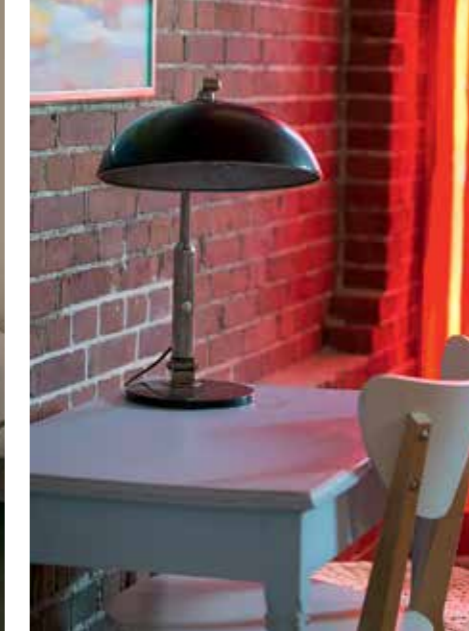
Ein Teil der verklankerten Außenmauer dient heute als dekorative Innenwand.