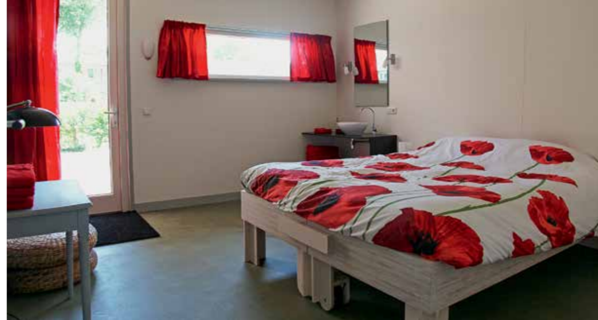
In den modernen Schlafzimmern erinnert nichts an eine Kirche.