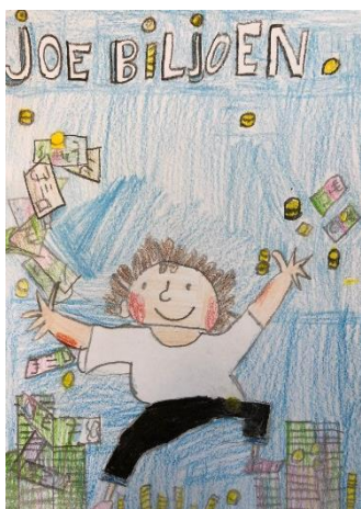
Het leesboek wat in groep 5 centraal stond.