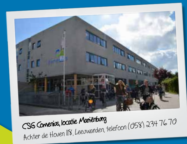
CSG Comenius, locatie Mariënborg Achter de Hoven 118, Leeuwarden, telefoon (058) 234 76 70

Op het aanmeldingsformulier kun je naast "havo" en "atheneum" ook een vakje aankruisen voor "Fast Lane havo" en "Fast Lane atheneum". Wanneer de aanmelddatum verstreken is, wordt de (eventuele) selectieprocedure gestart. Word je geplaatst in Fast Lane, dan zit je bij alle vakken (behalve de Talentstromen) in deze klas. Je komt dus niet in de klas bij leerlingen die de reguliere havo of het reguliere atheneum volgen.